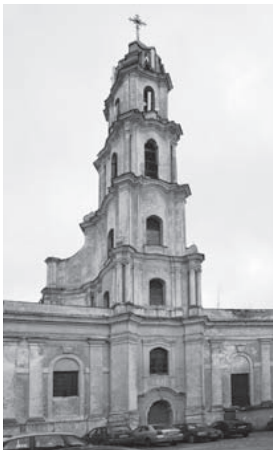
Vilniaus augustinijonų vienuolyno bažnyčia. 2010.