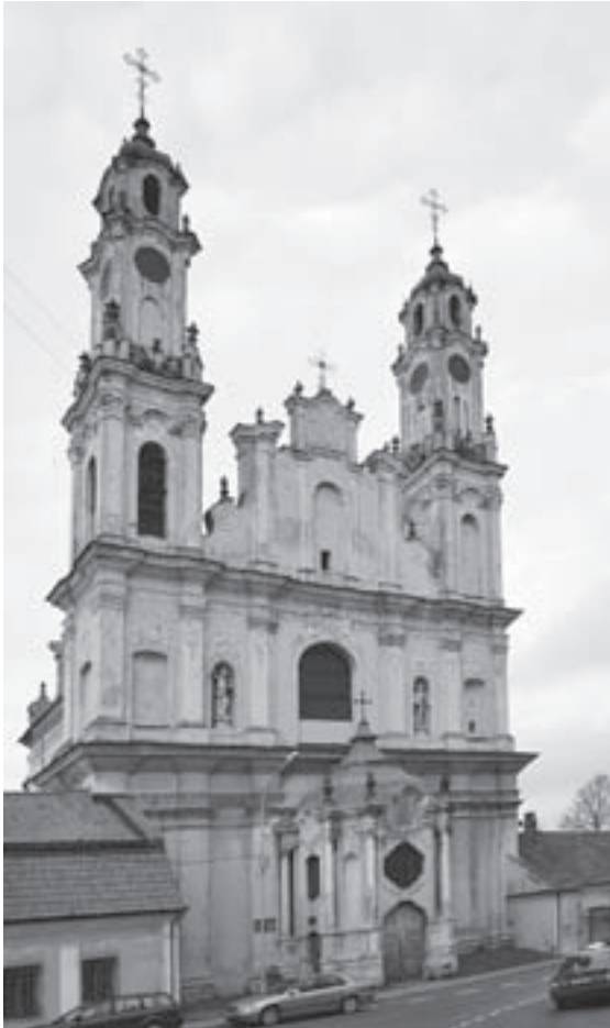
Vilniaus misionierių vienuolyno bažnyčia. 2010.

Vilniaus Baroko architektūrą kildina iš Pjemonto regiono architektūros (iš ten kilusių architektų) ir vienu svarbiu LDK dirbusių architektų laiko Antonio Paracca (1722–1790), kuriam