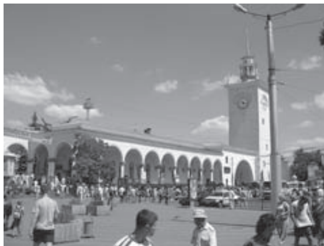
Simferopolio geležinkelio stotis. 2009

Krymo chereso taurė vakarieniškos bei kelionės pabai-gai. Ir dar vieno taksisto pasakojimas, kad jo, buvusio „mento“, pensija – apie 2000 Lt. „Tai todėl, kad mes giname prezidentą ir turtingųjų valdžią“, – sako neslėpdamas ironijos. Juk kiti pensininkai gauna apie 300 Lt. „Kokį prezidentą?“ „Kiekvieną, o koks skirtumas.“ Nepuolu diskutuoti. Juolab kad jis jau pareiškė nuomonę apie nykštukinę Lietuvą – „milijoną gyventojų“. „Ne milijonas, trys“, – atsargiai paprieštaravau. „A, vis vien mažiau, nei mūsų pusiasaly“, – girdžiu krymčianino pasididžiavimą. Ar lokalinis patriotizmas glaudžia rusakalbį kraštą prie Ukrainos, ar prie Maskvos?