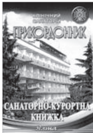
Sanatorijos Prikordonnik sanatorinė-kurortinė knygelė

ir šiandien sudaro jau ~12% rinkėjų. Totoriai kuriasi už kurortinių vietovių ir miestų, nesibrauna į greitą pelną nešantį turizmo verslą, tarsi „auginasi raumenis“. Tačiau dėl gausių šeimų jie netruks tapti trečia lygia jėga rusų ir ukrainiečių konkurencijos draskomoje pusiasalio visuomenėje. Visose stotelėse pardavinėjamos didžiulių raudonųjų svogūnų kasos ir medus (įdomus derinys!) – tai