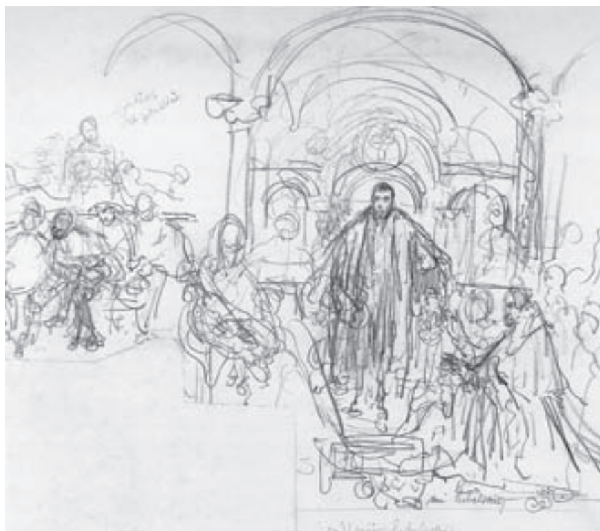
Jan Matejko. Apie 1869. Liublino unijos kompoziciniai eskizai