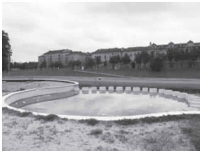
2004 m. Vilniaus paplūdimio baseinas pristatytas kaip viena pagrindinių atrakcijų laisvalaikio zonoje šalia Baltojo tilto. Vis dėlto vėliau pripažinta, jog baseinas tinkamas nebent atliekoms mesti. 2008.

spindesys dešiniajame Neris krante, šiandien papildomas ir „netrukus atsirasiančių“ europinių pinigų mitu, visų pirma kalbant apie vis dar neįgyvendintus stam-