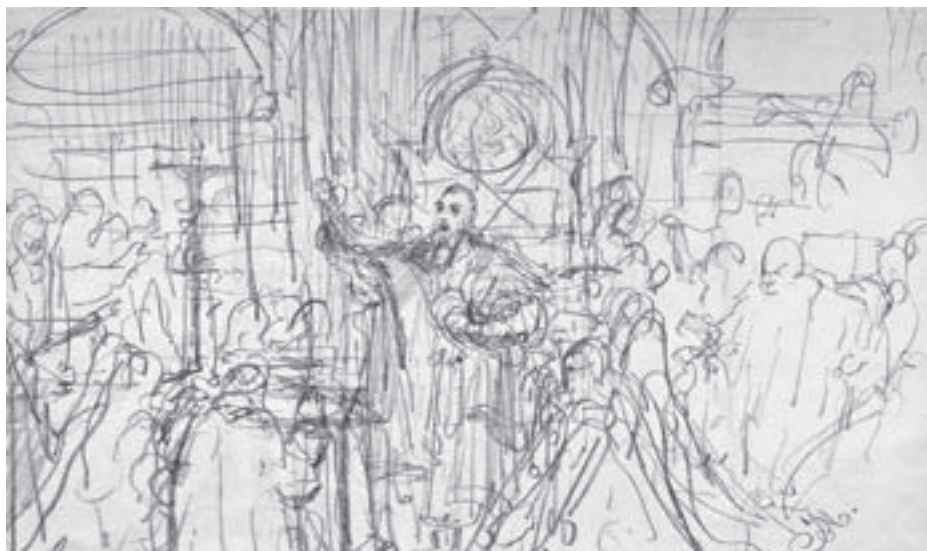
Jan Matejko. Apie 1869. Liublino unijos kompoziciniai eskizai

Socialinių procesų įsisavinimas „iš viršaus“ LDK istorijoje yra dailiai conceptualizuotas prof. Edvardo Gudavičiaus. LDK visuomenė, kaip Vakarų civilizacijos periferija, prisijungusi prie centro per krikštą gerokai pavėlavusi, „antistatinius“ reiškinius (politinę kultūrą, institucijas ir t. t.) perėmusi daug greičiau, o lėčiau besivystančiai visuomenei tekę juos vyti. Gudavičiaus teigimu, „Europos periferijos visuomenė priminė kampu pastumtas kortų kalades: viršutinės jų kortos buvo visai ar beveik pasiekusios liniją, kurią lietė centro visuo-