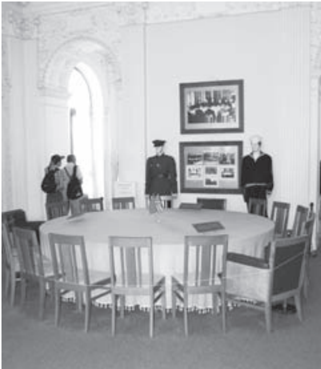
Istorinė salė Livadijos rūmuose, kurioje 1945 m. vyko Jaltos konferencija. 2009.

Taigi iškentęs vieną posėdį, be sąžinės skrupulų drožiu į Livadijos rūmus. 1945 m. vasarį juose vykusiai Jaltos konferencijai – pokarinės Europos dalyboms – skirta pirmojo aukšto ekspozicija. Autentiškų nuotraukų kopijos ir dokumentinių filmų ištraukos patvirtina, jog interjeruose išlaikyta Stalino, Roosevelto ir Churchillio susitikimo aplinka. Gausu vokiečių pensininkų, kurie užsiima mazochizmu, klausydami vietinių gidų pasakojimų apie Josifą Visarionovičių – karo genijų ir toliaregį taikos projektuotoją. Nuostabu, kaip tie patys gidai pakeičia plokštelę antrame aukšte, kur