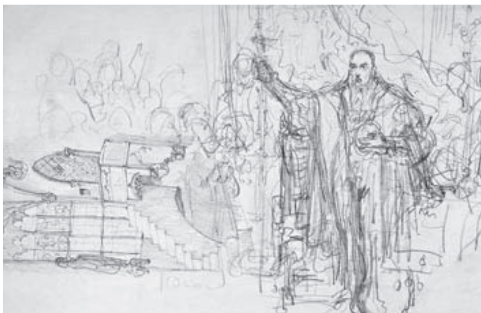
Jan Matejko. Apie 1869. Liublino unijos kompoziciniai eskizai