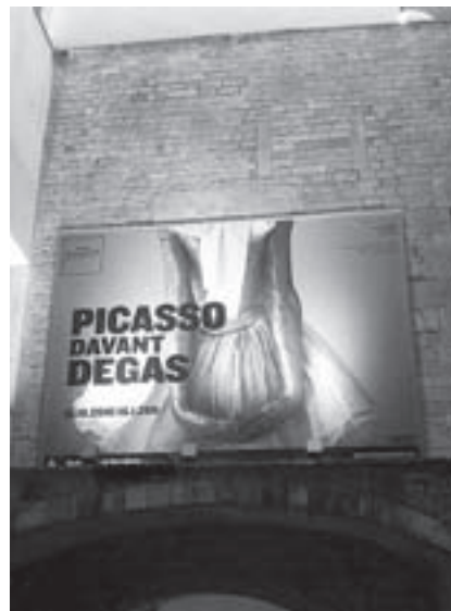
Parodos „Picasso žiūri į Degas“ afiša.

įdomūs Domenico Ghirlandaio „Damos portretas“ ar jau minėtas Ugolino da Siena (Ugolino Nerio) altorius. Kolekcijoje esančių XIV–XV a. italų