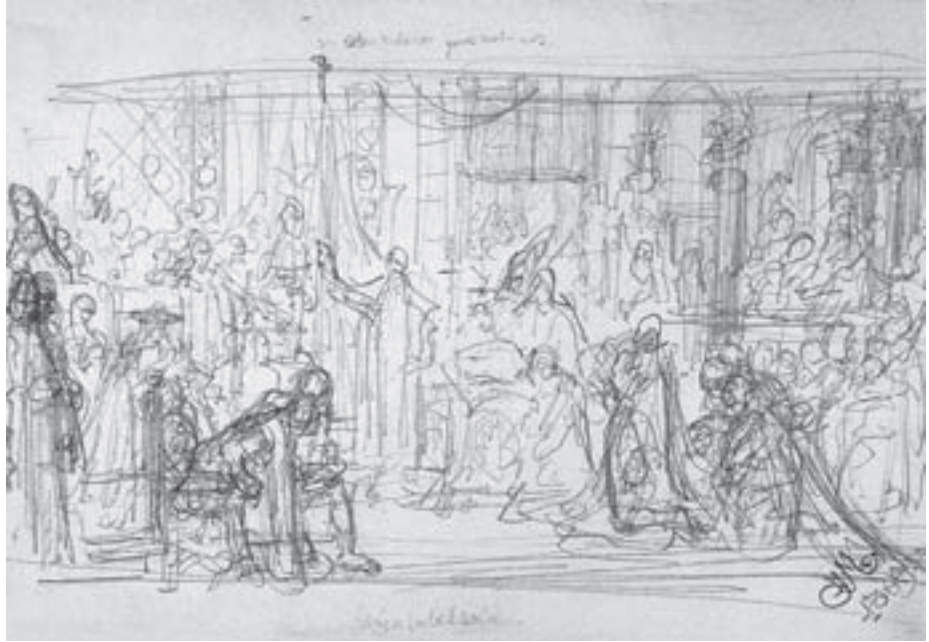
Jan Matejko. Apie 1869. Liublino unijos kompoziciniai eskizai