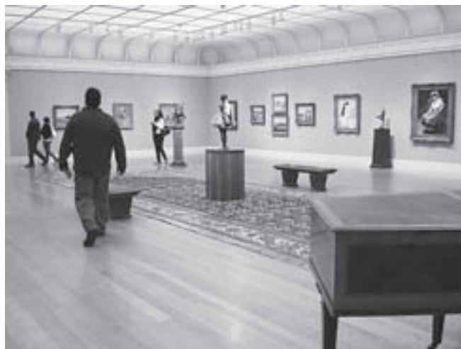
Clarkų muziejaus ekspozicijos salė. www.wikimedia.org

me – North Adamse – įsikūrusiu Masačusetso šiuolaikinio meno muziejumi ( Massachusetts Museum of Contemporary Art ). Šis buvusios gamyklos komplekse įsikūręs muziejus neturi nuolatinės kolekcijos – tai parodų ir projektų centras, žinomas dėl itin intensyvios veiklos.