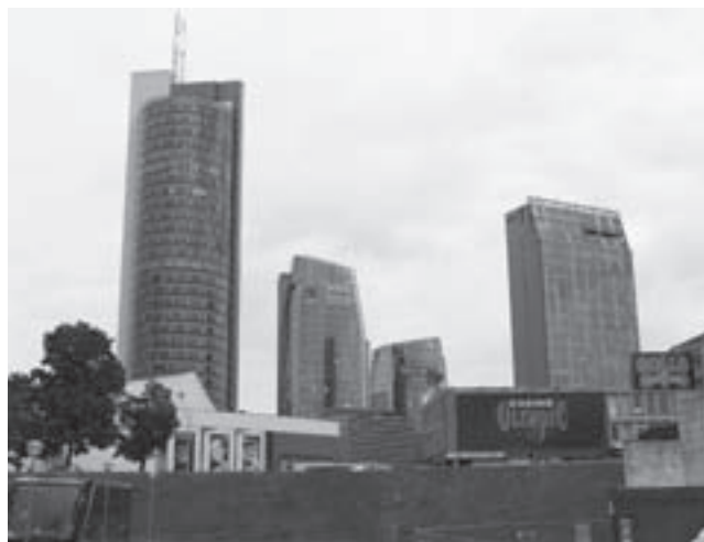
Naujieji Europos aikštės statiniai žvelgiant nuo Reval Hotel viešbučio prieigų. Pirmame plane – kazino ir striptizo klubas, už jų stiebiasi Vilniaus m. savivaldybė. 2008.

Nekilnojamo turto vystytojų pradėtą dešiniojo Nerios kranto pertvarką papildė įvairūs pramoginiai, pilietiniai ir masiniai kultūros renginiai naujoje Europos aikštėje bei šalia Baltojo tilto. Nors vakarais šioje teritorijoje ryškiau sužiba nebent Reval hotel arba Olympic Casino užrašai, – toli gražu ne lietuviškos, o tarptautinės ekonomikos ženklai, – bet čia esama ir akivaizdžiai lokalių dalykų. Senosios elektrinės vietoje įkurtas Energetikos muziejus pristato šalies technikos paveldą, o 2009 m. rekonstruotame Revoliucijos muziejuje