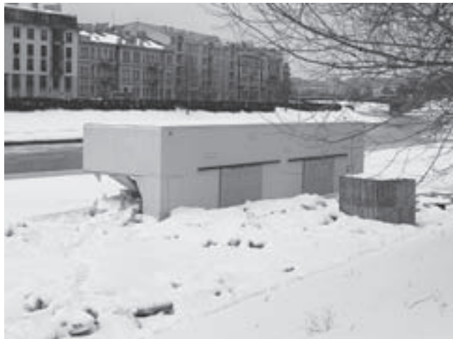
Kultflux paviljonas. Vilnius. 2008 m. žiema.

Deja, nors gentifikacijos procesai ir vyksta pagal įprastas plėtros formules, bet globalios naujosios ekono-