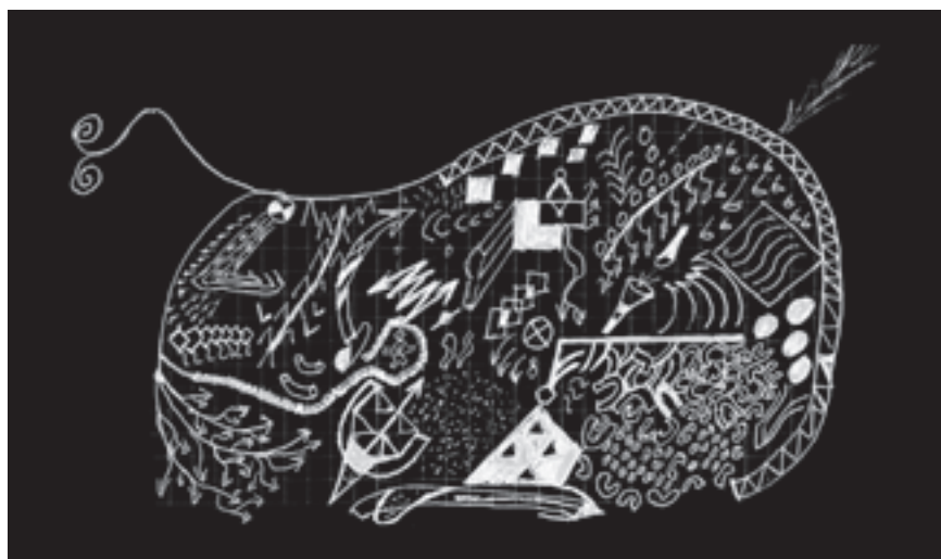
Wladzūne Pezkel. Pranešėjas Jona barginio pilve 2. 2010. Buitinė grafika

Konferencijos užmojai – milžiniški, ir informacijos pratekėjo labai daug. Bet pranešimai sesijose buvo glaudžiai susiję, vienas kitą papildydavo, pristatydami ir europinį kontekstą, ir regiono specifika. Manytume, ne vienas mitas buvo visiškai sugriautas arba stipriai pastūmėtas link praeities tikrenybių. Liūdna tik, kad didžiąją