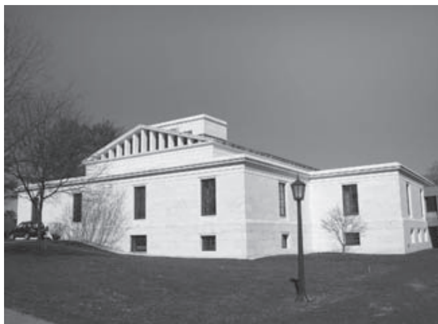
Clarkų Meno instituto Williamstowne senosios galerijos pastatas.