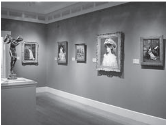
Clarkų muziejaus ekspozicijos salė. www.wikimedia.org