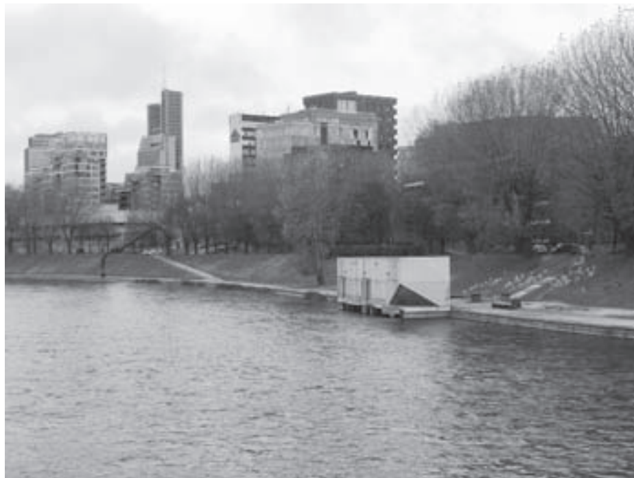
Kultflux paviljonas. Vilnius. 2010.

Nors dešiniojo Neries kranto atgaivinimo iniciatyvos oficialiose pastarojo dešimtmečio ataskaitose tapatinamos su atgimusio Europos miesto simboliais, kol kas akivaizdu nebent tai, jog Vilniaus kultūrinės strategijos jau kurį laiką iliustruoja urbanistinę laikinumo utopiją. Ją galima traktuoti kaip savitą vilnietiškąjį fluxus –