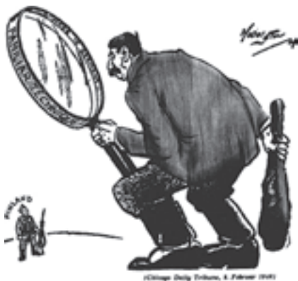
Karikatūros iš 1937–1941 m. periodinės spaudos

Tai galbūt techninis klausimas. Hitlerizmas ir visas režimas buvo su-triuškintas, o stalinizmas tiesiog taciai transformavosi. Taigi jie sulaukė labai skirtingų pabaigų. Tačiau man atrodo, kad tai šiek tiek klaidinantis klausimas. Nesu linkęs taip jų lyginti. Dabar madinga sakyti, kad tai iš esmės tas pats. Bet aš nemanau, kad tai tiesa. Akivaizdu, kad mes niekada