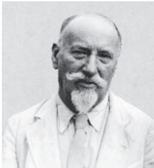
Feliksas Koneczny (1862–1949)

Nagrinęjant Šalkauskio Rytų ir Vakarų kultūrų sintezės sampratą, būtina prisiminti tarpukario Lietuvos kultūrinio ir politinio gyvenimo aplinkybes. Susikūrus nepriklausomai Lietuvos tautinei valstybei, buvo atsisakyta kultūrinės tradicijos, kuriai priklausė Koneczny. Reikėjo daug ką pradėti iš naujo. Atsirado poreikis naujai interpretuoti Lietuvos istoriją ir numatyti gaires tautos kultūros ateičiai. Būtent šiame kontekste išvirtino garsioji Šalkauskio Rytų ir Vakarų kultūrų sintezės idėja. Šalkauskis lietuvių kultūrai ir jos istorijai suteikė naują – filosofinį matmenį.