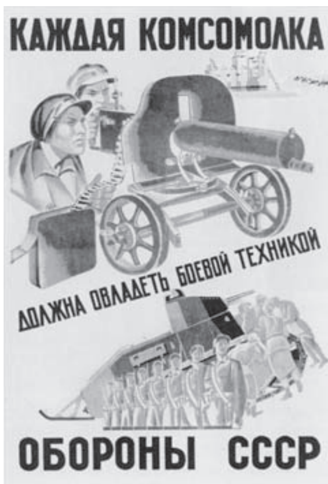
Sovietinis plakatas „Kiekviena komсомolka privalo išmokti naudotis SSRS gynybos kovine technika“. 1932

Man tai palieka stiprų įspūdį, nes kažką panašaus matau skaitydamas iš pirmo žvilgsnio visiškai teorinį veikalą – Hannah Arendt Totalitarizmo ištakas. Ji taip pat po kruopelę renka visus tuos dalykus, kurie jai atro-