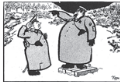
(Le Petit Parisien, 1. Februar 1945)

Teisingai, Rusija yra Rusija. Aišku, jiems neįdomus Chruščiovas, nes juos domina tik sėkmė. Kaip ir visoms kitoms valstybėms rūpi tik sėkmė. Kaip