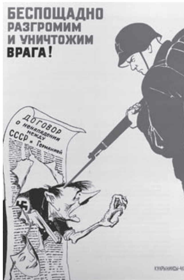
Kukryniksai. Sovietinis plakatas „Negalėstingai sutriuškinsime ir sunaikinsime priešą!“. 1941

istorijos žodžiu egzaminą išsitraukiau klausimą apie Vokietijos ir SSRS karo pradžią. Suprantama, norėjosi sublizgėti neknygine išmintimi, o ir antikomunistinis entuziazmas per kraštus netilpo... Pradėjau pasakoti nuo to, ką mano senelis ne kartą buvo pasakojęs apie pirmas karo dienas. Jis, stovėdamas netoli kelio, mato,