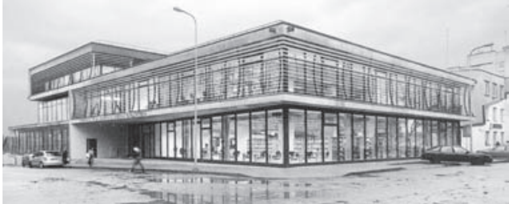
Viešoji A. ir M. Miškinių biblioteka Utenoje.

Dar įdomesnis vaizdas prie daugiabučių. Čia būriuojasi