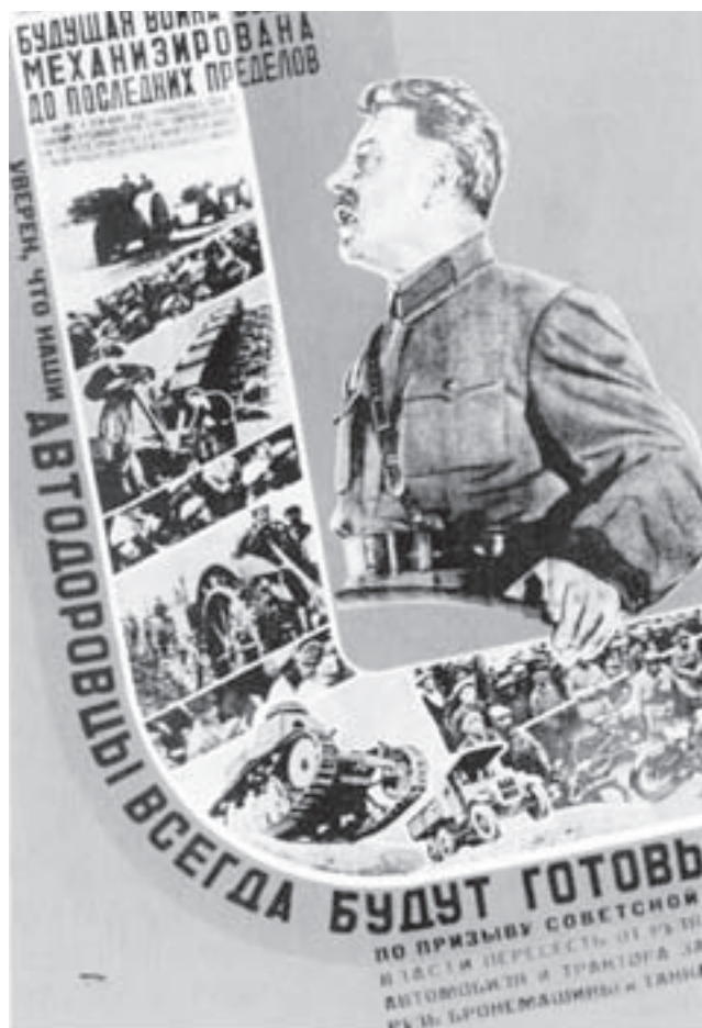
Sovietinis plakatas „Būsimasis karas bus mechanizuotas iki pat pagrindų“. 1931

karo istorija – tai didžiulis klaustukas. Ir apskritai manau, kad tai vienas svarbiausių jo nuopelnų. Visi galvoja, kad padėtas taškas. O atėjo Suvorovas ir paaiškėjo, kad tai didžiulis klaustukas ir kad apskritai labai daug kas neaišku, paaiškėjo, kad netgi įmanoma koncepcija, paneigianti viską... Koncepcija, be to, visiškai logiška. Pasirodo, mes dešimtis metų kaip avinai stebėjimės ir nematėme, – šia prasme Suvorovo knygos davė didžiulį postūmį apskritai iš pagrindų užsiimti šiuo dalyku. Tačiau apie kokį tiesioginį perėmimą, – aš apie tai negalvoju. Mane visuomet traukė ir tebetraukia skaičiai. Kai man pavyksta rasti „gerus skaičius“, tai pradėdau šokinėti iš pasitenkinimo kaip sviedinukas. Paskutinis, mano požiūriu, nuostabus atradimas – kul-