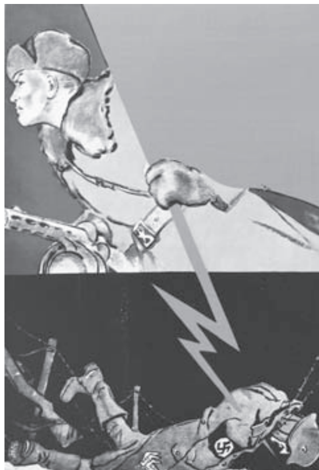
Kukryniksai. Sovietinis plakatas. 1941

kaip visiškai teisingą priekaištą ir to, apie ką aš rašau, tam tikro silpnumo konstataciją. Žinoma, tai, kurlink aš judu, reikalauja labai rimto tobulinimo (tai paprastai paliekama kitiems tyrinėtojams). Ir vis dėlto daugelis tų dalykų, kuriuos Jūs įvardijote, man žinoma, aš tai skaitau. Kaip tai atsispindi mano knygoje? Aš stengiuosi paįšyti daugialypį paveikslą. Nuolat einu pats ir mėginu vesti skaitytoją tolyn nuo tiesmukų išvadų. „Blogas Stalinas, – o mano įsitikinimu, jis tikrai buvo blogas, – ir visi nepanoro už jį kariauti, sudėjo ginklus ir patraukė namolei.“ To nebuvo ir apskritai žmogaus elgesys kare, – pereinant nuo šarvo storio prie žmogaus elgesio, – yra sąlygojamas daugelio veiksnių, tarp kurių bendras gėrio ir blogio supratimas, politiniai įsiti-