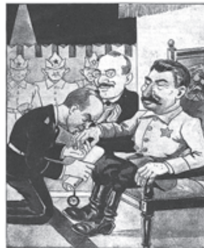
STALIN. – PIRMA JO ŽALTA. MOKSLO IR KULTŪROS MINISTERIJA. TU MOKSLO IR KULTŪROS MINISTERIJA. TU MOKSLO IR KULTŪROS MINISTERIJA.

O kas yra toji socialistinė valstybė? Sovietų Sąjunga nebuvo tikra socialistinė valstybė, nes tikroje socialistinėje valstybėje nėra valstybės, nėra nelygybės, o juk Sovietų Sąjungoje buvo milžiniška nelygybė. Tiesą sakant,